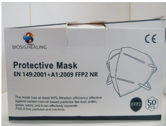
Verpackung / Packaging

Die folgende Maske wurde geprüft / The following mask was tested: