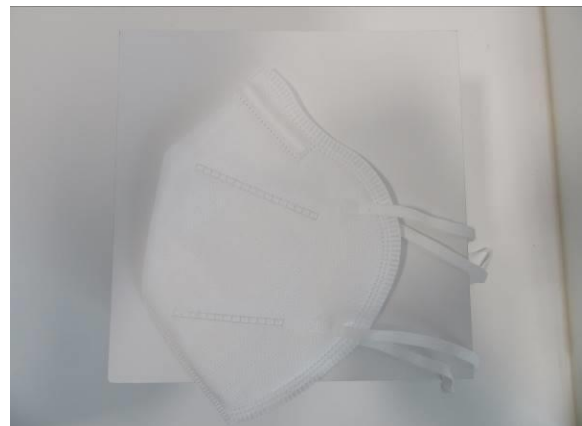
Seitenansicht / Side view