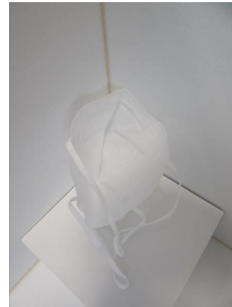
Innenansicht / Inner view