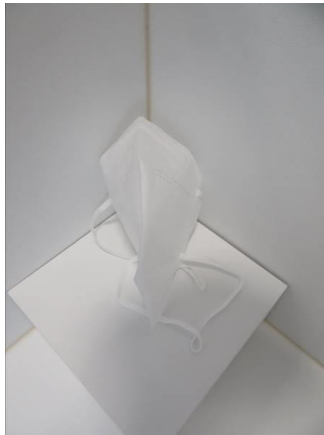
Frontansicht / Front view